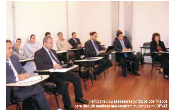
Femipa reuniu assessores jurídicos dos filiados para discutir medidas que revertam mudanças no DPVAT