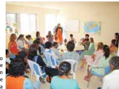
Hospital ampliou infraestrutura com recursos obtidos junto à comunidade

Para aqueles hospitais que atendam crianças e adolescentes e possam se enquadrar nas regras dos Conselhos de direitos, o gerente de marketing faz uma alerta: "não basta ter o projeto e não ter quem possa apresentá-lo às empresas e dar visibilidade à comunidade. É necessário ter uma equipe própria para esse fim", afirma. Ele lembra ainda, que há outras possibilidades de captação de recursos como os programas de doação continuada com a utilização ou não do telemarketing. "É importante ter a consciência de que não existe fórmula mágica, pois a montagem de um programa como esse trará