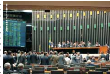
Plenário decide pela rejeição da MP das Filantrópicas

A decisão evita que a matéria tenha de ser analisada pelo Senado, que já se recusou uma vez a examinar o assunto. Agora, a Câmara deve votar um decreto legislativo para decidir o que acontecerá com as filantrópicas que conseguiram a renovação do seu registro enquanto a